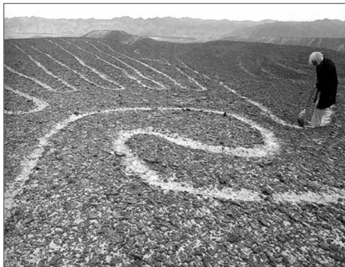
Obtahování obrysů obrazců na planině Nazca, pořádně viditelných pouze z výšky

Jak je dobře známo, v šedesátých letech minulého století spisovatelé jako Louis Pauwels, Jacques Bergier a Erich von Däniken razili myšlenku, že přímky sloužily mimozemským návštěvníkům jako vzletové a přistávací dráhy. Jiní se dohadují, že jde o astronomický kalendář, využívaly se k náboženským obřadům nebo označovaly podzemní zdroje vody. Jeden expert soudí, že před vynálezem tkalcovských nástrojů muži stáli na těchto linkách a drželi vlákna, čímž vytvářeli jakýsi lidský tkalcovský stav. Nic-